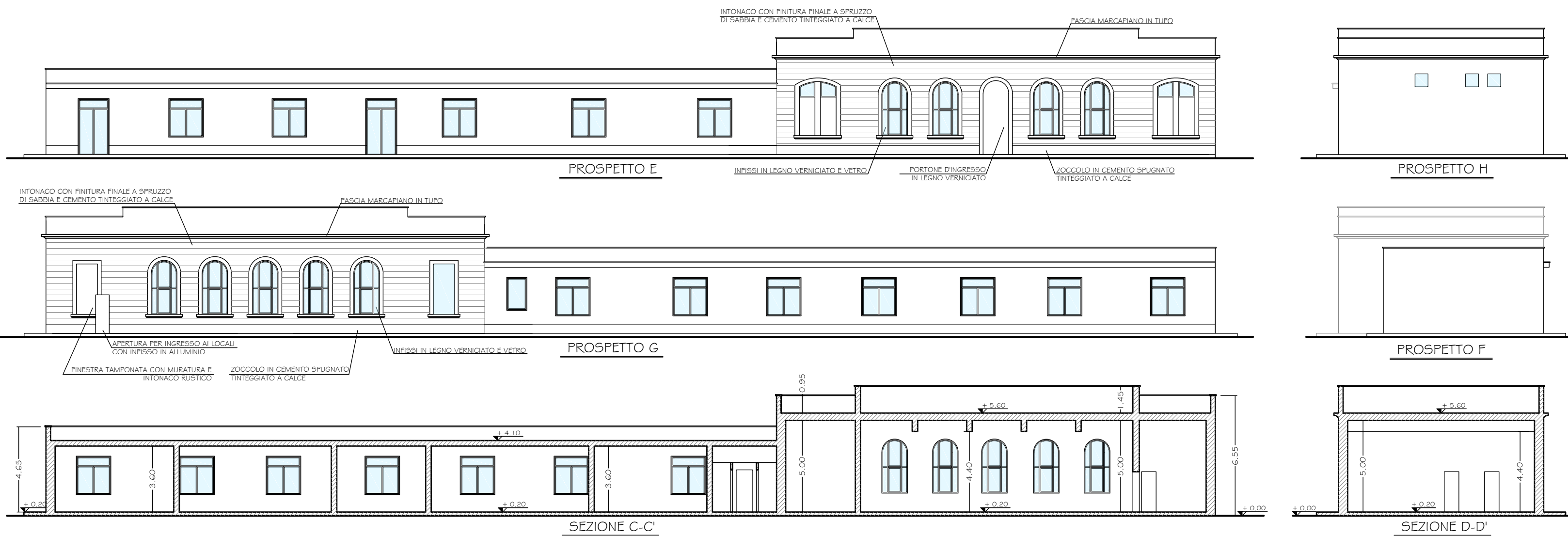
PIANTA PIANO COPERTURA